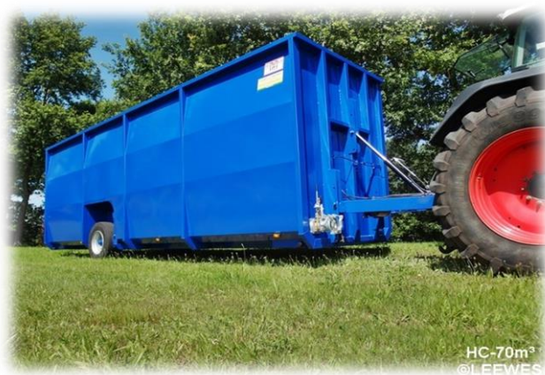
HC-70m 3 ©LEEWES