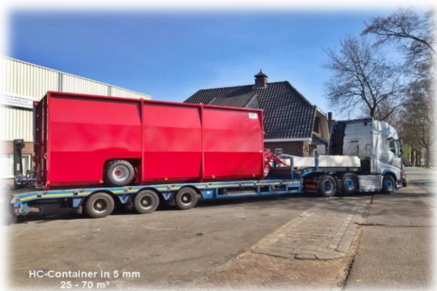
HC-Container in 5 mm 25 - 70 m 3