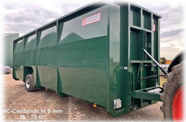
HC-Container in 5 mm 25 - 70 m 3