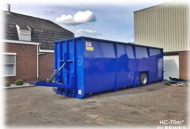
HC-70m 3 ©LEEWES