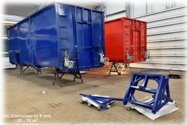
HC-Container in 5 mm 25 - 70 m 3