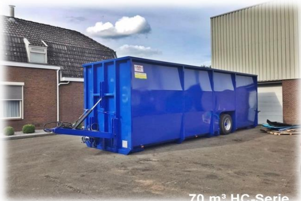
70 m 3 HC-Serie