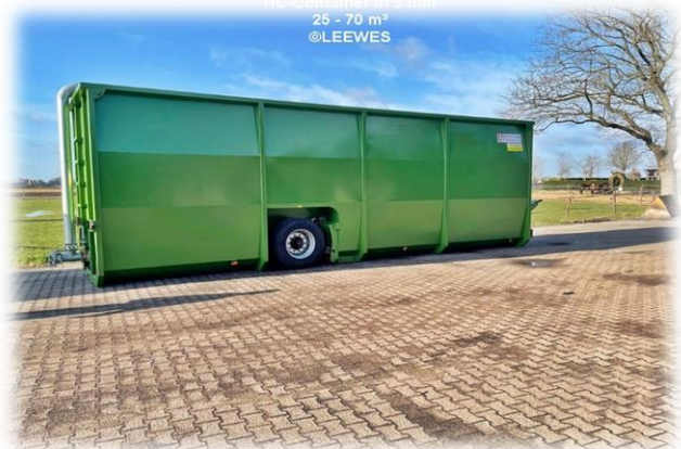
HC-Container in 5 mm 25 - 70 m 3 ©LEEWES