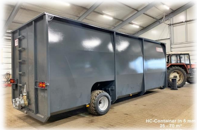
HC-Container in 5 mm 25 - 70 m 3 ©LEEWES